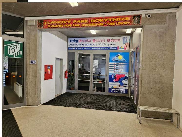
prostor půjčovny a servisu v budově dolní stanice lanové dráhy Horní domky