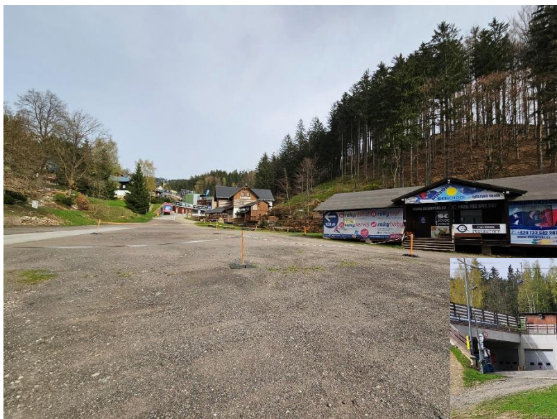
zázemí lyžařské školy na parkovišti P1 v blízkosti dolní stanice lanové dráhy Horní domky