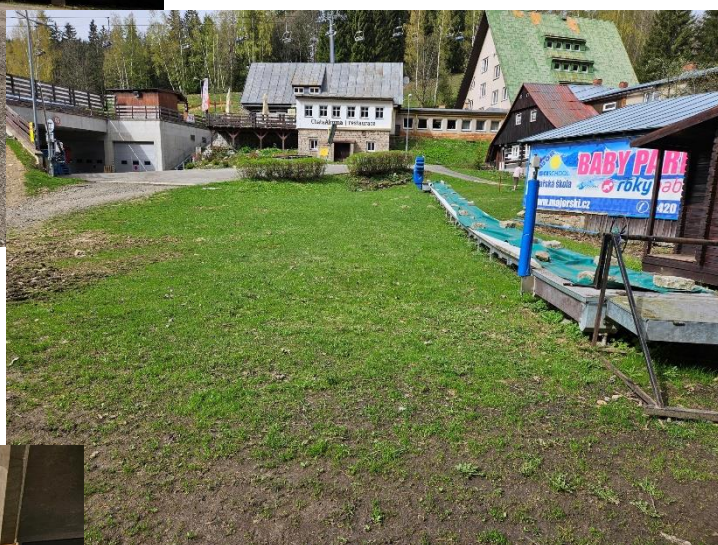
dětský pojízdný pás Sun Kid